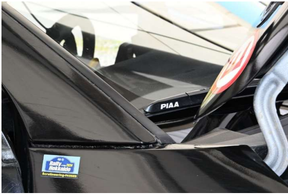
PIAA 撥水ワイパーは多くのマシンに装着頂きました