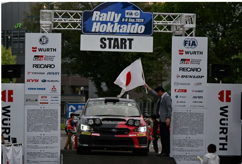
セレモニアルスタートのSUBARU WRX STI

この奴田原選手に続いたのが、WinmaX RALLY TEAMで58号車「WinmaX DL シムス WRX STI」のステアリングを握る鎌田卓麻選手だった。鎌田選手のWRXは車両重量が重いことから、厳しい戦いを強いられてきたが、それでも第5戦のモンレーおよび第6戦のラリー・カムイで殊勲の6位入賞を果たすなど粘り強い走りでポイントを獲得してきた。その鎌田選手xWRXのパフォーマンスはラリー北海道も健在で、サバイバルラリーが展開されるなか、鎌田選手は6番手でレグ1をフィニッシュ。