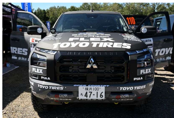
Day1 で破損したマシンを直して Day2 に備える FLEX SHOW AIKAWA Racing with TOYO TIRES トライトン