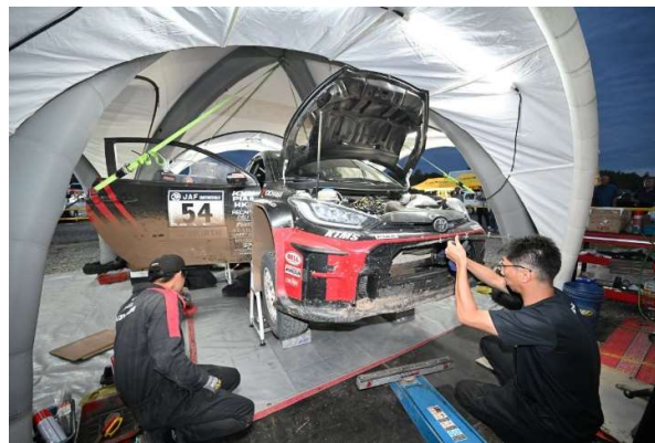
Day1 終了後にサービス（車両整備）