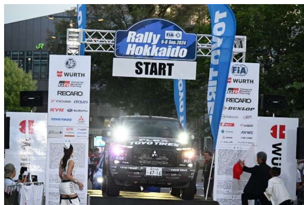
PIAA LED ランプを装着しスタートする FLEX SHOW AIKAWA Racing with TOYO TIRES トライトン