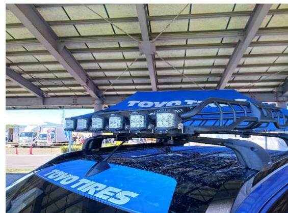
サービスパークイベント会場に展示した TOYO TIRES トライトンに PIAA LED、Terzo ルーフキャリアを装着