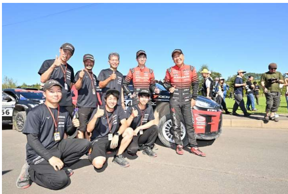
NUTAHARA RALLY TEAM メンバー