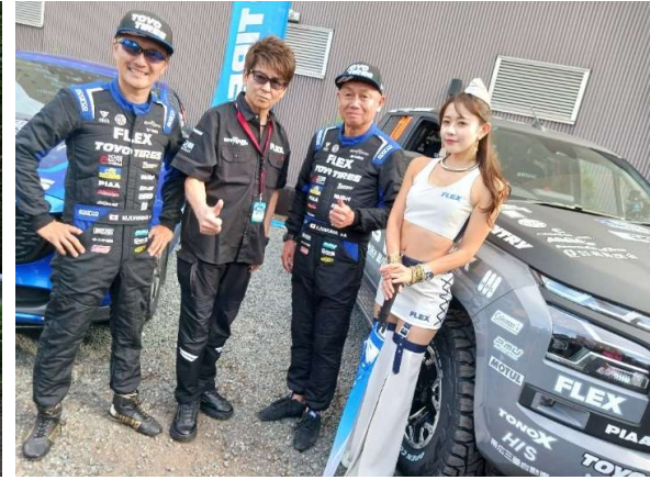
ぶっつけ本番デビューの三菱トライトン