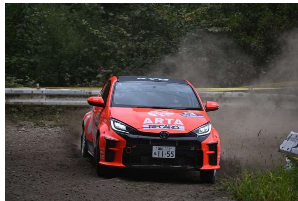
JN2 クラス初優勝 ARTA オートボックスラリーチームの GR ヤリス 石川選手、大倉選手組

またラリー北海道で注目を集めていたのだが、全日本ラリー選手権と同時開催で行われた XCR スプリントカップ北海道の第4戦で、SUV やピックアップトラックが豪快な走りを披露。そのなかで最も注目を集めていたのが、哀川翔総監督率いる FLEX SHOWAIKAWA Racing with TOYO TIRE の 110 号車「FLEX 翔 TOYOTIRES トライトン」で、ドリフト競技やクロスカントリーラリーで活躍する川畑真人選手が PIAA のランプシステムを採用したトライトンで OP-XC2 クラスに参戦していた。残念ながら 110 号車の川畑選手は SS2 でロールオーバーを喫し、レグ1 を離脱することとなったが、レグ2 で再出走を果たすと SS9 でベストタイムをマークするほか、SS11 で 2 番手タイムをマークするなど素晴らしいパフォーマンスを披露していた。