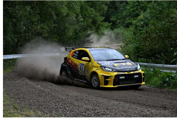
MATEX-AQTEC DL GR ヤリス 柳沢選手、竹下選手組 カヤバ GR ヤリス 石原選手、穴井選手組

一方、JN2 クラスに目を向ければ石川昌平選手を起用し、66 号車「ARTA オートボックス GR ヤリス」を投入する ARTA オートボックスラリーチームも PIAA のサポートチームで、2 回の SS ウィンを獲得し、レグ1 をトップでフィニッシュ。レグ2 でもコンスタントな走りでポジションをキープし、JN2 クラスで初優勝を獲得した。