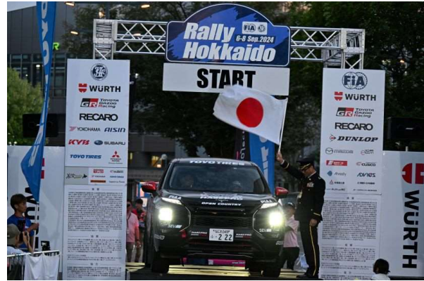
ハセプロトーヨータイヤ GN アウトランダー 長谷川選手、厚地選手組

また、チーム岩手トヨタ GEOLANDER で 118 号車「岩手トヨタ GEOLANDER ライズ」を駆る埜部夫選手も PIAA のサポートチーム&サポートドライバーで、PIAA の LED をフロントバンパーに組み込んだコンパクト SUV を武器に安定した走りを披露、OP-XC3 クラスで 2 位入賞を果たした。