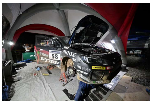
WinmaX DL シムス WRX STI